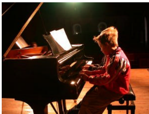
Glimt fra fjorårets 4.klasse-besøk.